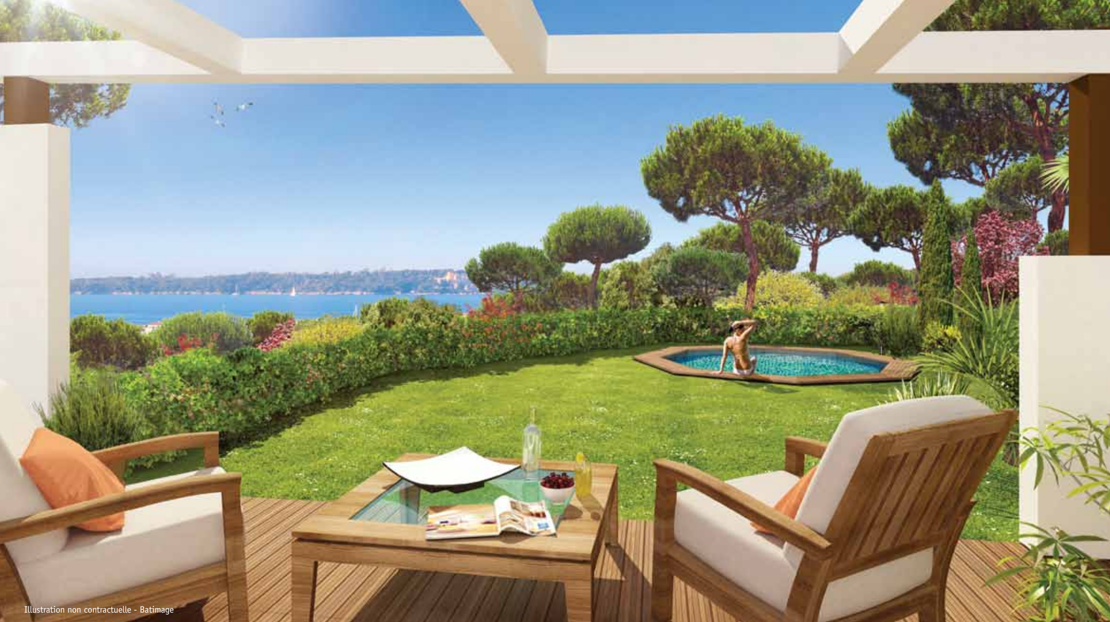
Illustration non contractuelle - Batimage