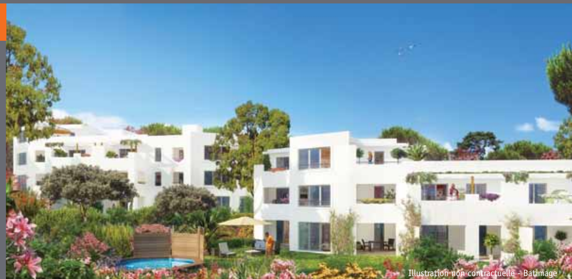
Illustration non contractuelle - Batimage