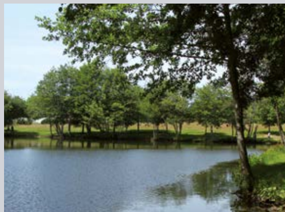
Parc de la Gournerie