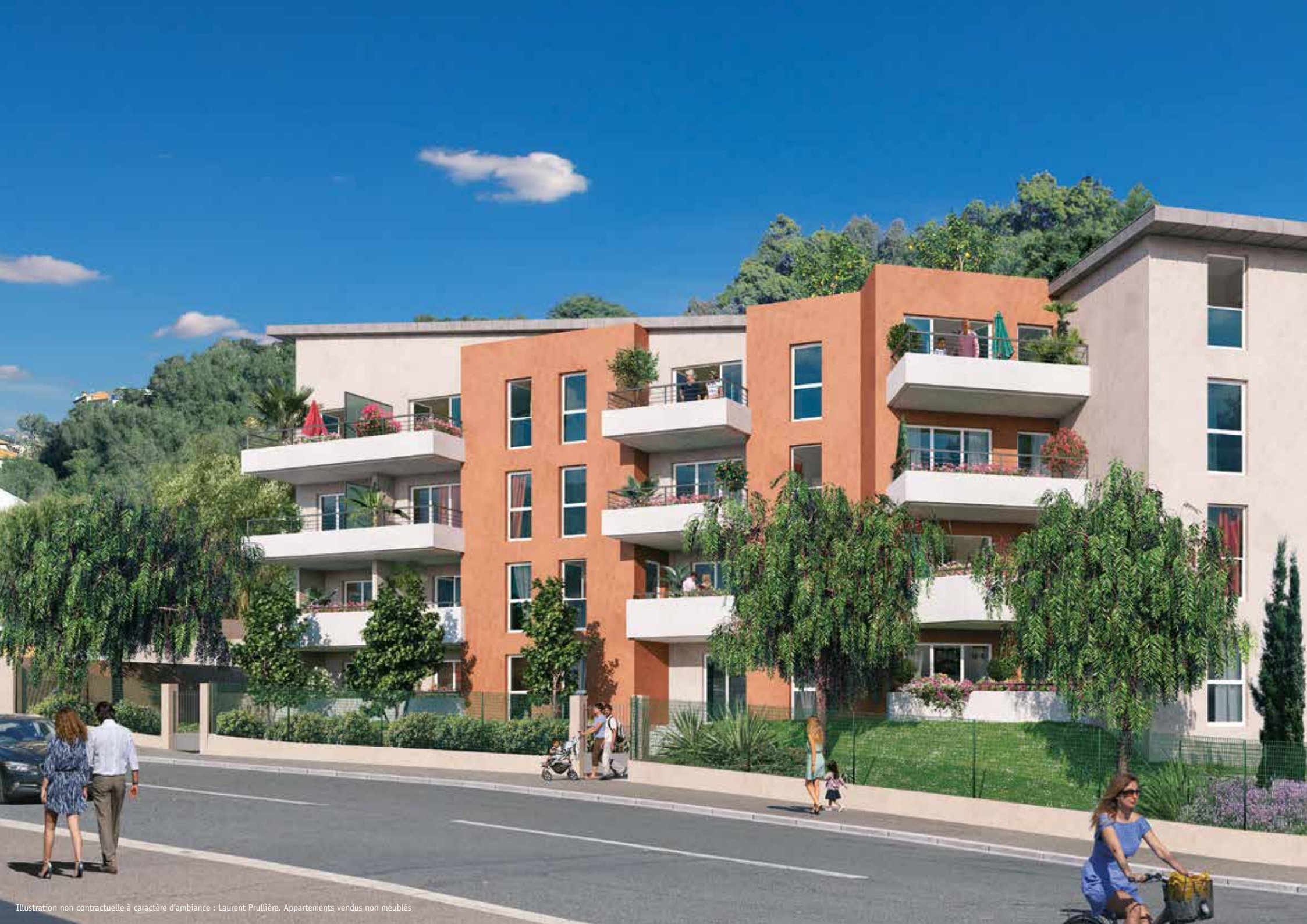
Illustration non contractuelle à caractère d'ambiance : Laurent Prullière. Appartements vendus non meublés