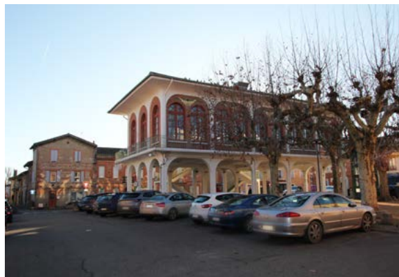
Halle de la Grande Place

Les amateurs de sport apprécieront la diversité des clubs locaux, allant du rugby au tennis, en passant par le football, le judo et le cyclisme. La fête locale de Longages, célébrée chaque année à la mi-août, ainsi que la fête de l'association Labour Passion le premier dimanche de septembre, sont au cœur de la vie culturelle du village. De nombreuses activités culturelles telles que la Chorale de Longages ou les animations estivales au lac de Sabatouse enrichissent la vie des habitants, faisant de cette ville un lieu où il fait bon vivre.