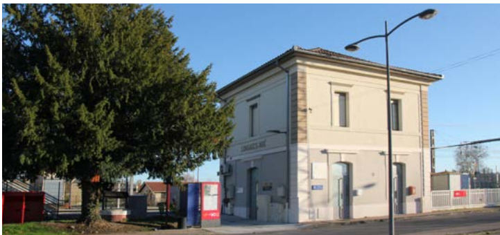
Gare de Longages - Noé

Dotée d'un climat ensoleillé tout au long de l'année, Longages encourage diverses activités en plein air telles que le cyclisme, les randonnées pédestres ou les sports aquatiques.