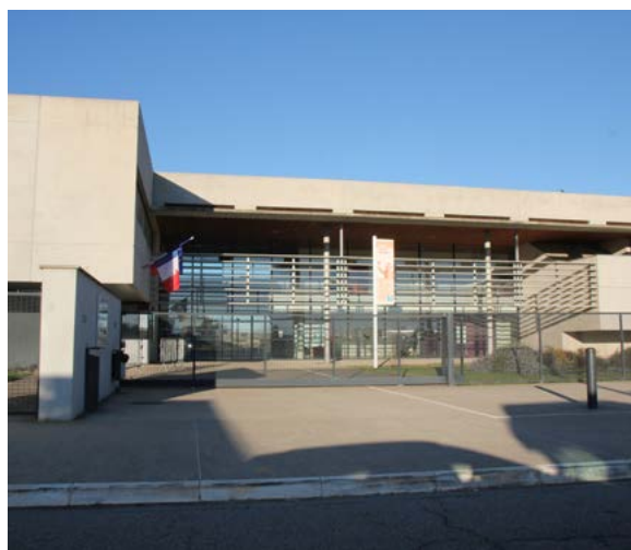
Collège Nelson Mandela à Noé