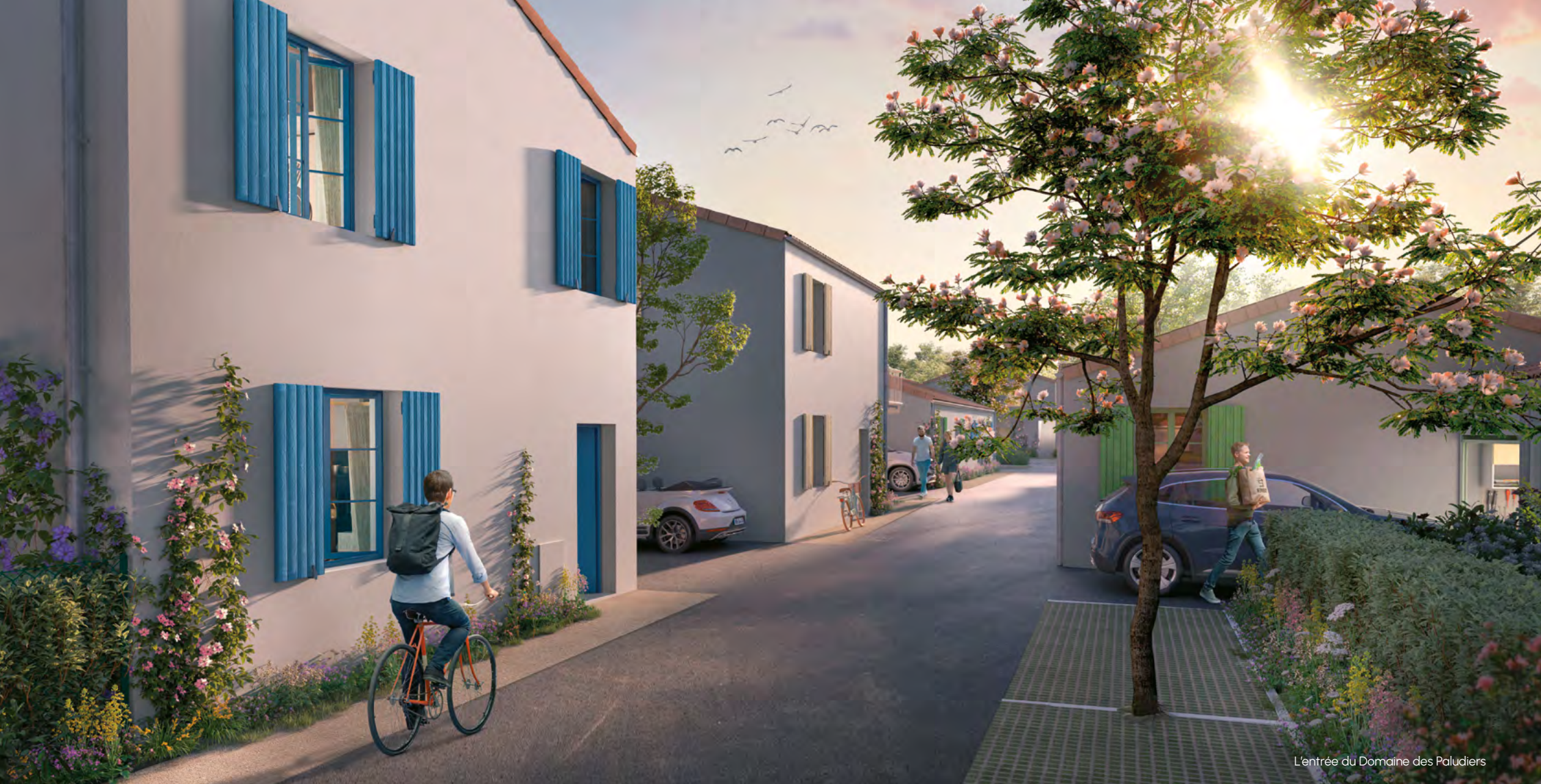
L'entrée du Domaine des Paludiers